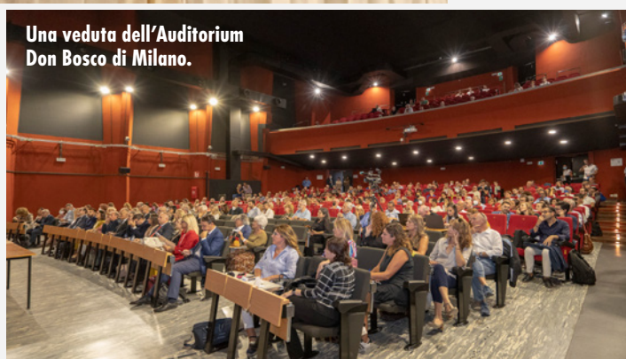
Una veduta dell'Auditorium Don Bosco di Milano.