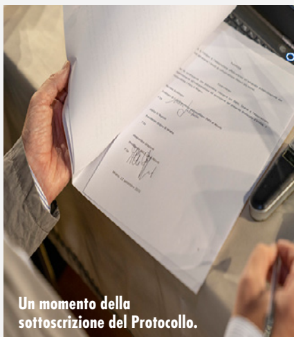
Un momento della sottoscrizione del Protocollo.