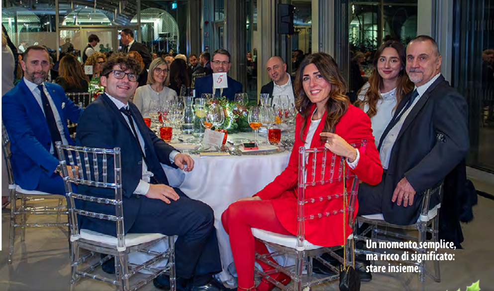
Un momento semplice, ma ricco di significato: stare insieme.