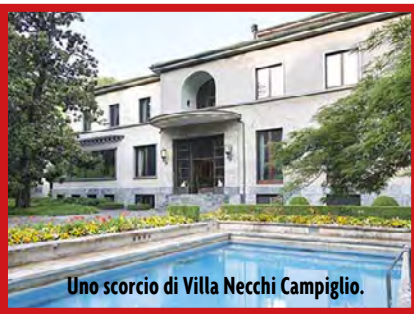
Uno scorcio di Villa Necchi Campiglio.