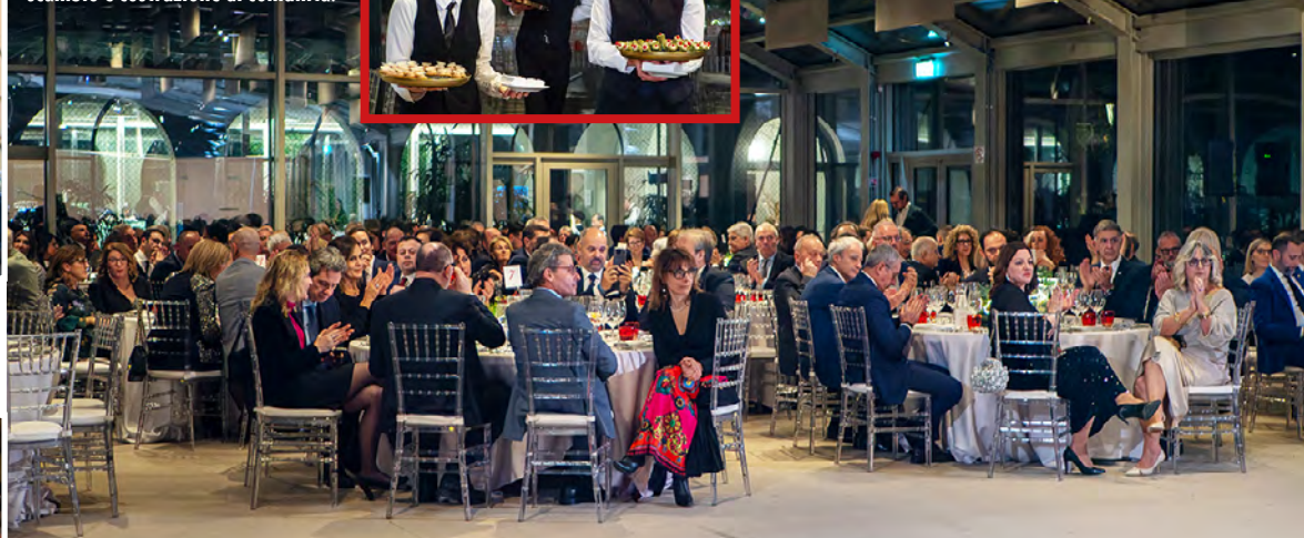
La tavola come luogo di relazione, scambio e costruzione di comunità.