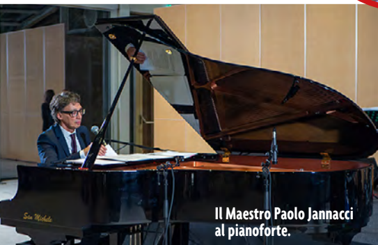
Il Maestro Paolo Jannacci al pianoforte.

La serata conviviale del 12 dicembre 2025, organizzata congiuntamente da Ancl Up Milano e dall'Ordine dei Consulenti del Lavoro di Milano, ha riunito ospiti di particolare prestigio nella straordinaria cornice di Villa Necchi Campiglio. All'evento hanno partecipato rappresentanti istituzionali di primissimo piano, tra cui il Presidente dell'Inps, Gabriele Fava, esponenti della Regione Lombardia e della Città Metropolitana di Milano, accademici di chiara fama, le massime autorità nazionali e locali dell'Ordine dei Consulenti del Lavoro provenienti da tutta Italia, ➤