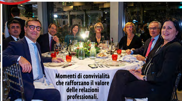
Momenti di convivialità che rafforzano il valore delle relazioni professionali.