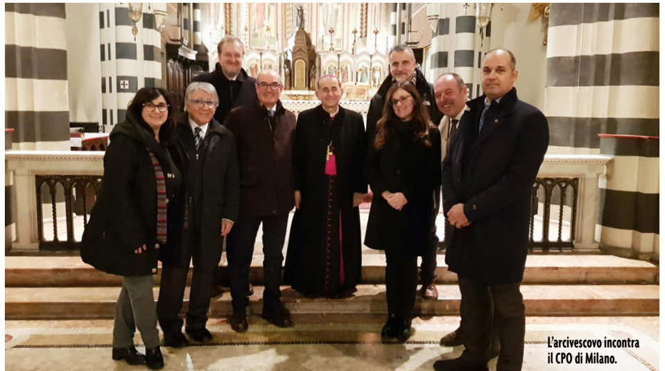
L'arcivescovo incontra il CPO di Milano.