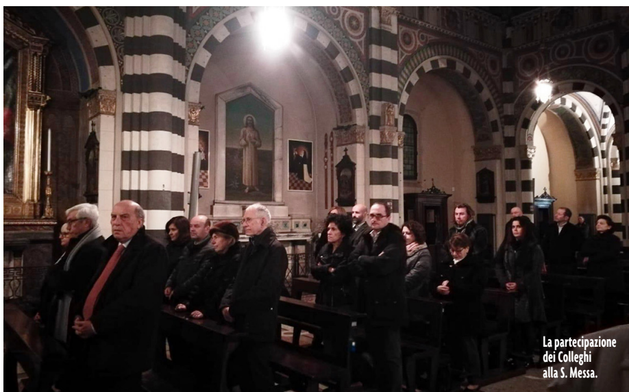
La partecipazione dei Colleghi alla S. Messa.