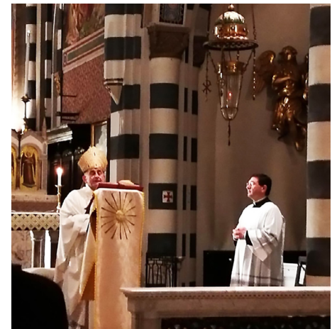
Monsignor Delpini officia la Santa Messa.

I Consulenti del Lavoro e la Curia milanese hanno deciso quindi di collaborare su progetti specifici che possano aiutare i cittadini e le famiglie bisognose. La commissione del CPO di Milano "Consulenti del lavoro per il sociale" si farà parte attiva e proporrà le possibili iniziative per raggiungere gli obiettivi prefissati. ➤