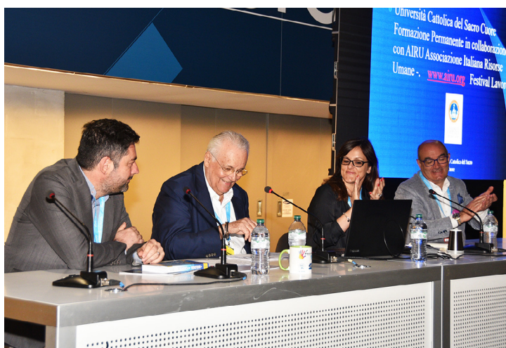
A sinistra, un momento del dibattito.

per imprese e consulenti del lavoro accettare le sfide che il futuro già ... oggi (!) ci presenta e riflettere sulla evoluzione anche della professione di consulente del lavoro.