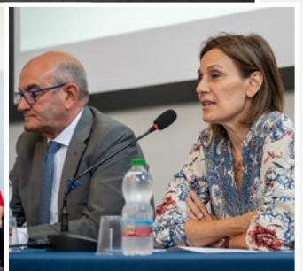
Ancora dei momenti della cerimonia, la sala con i colleghi e i familiari e del conclusivo light lunch.