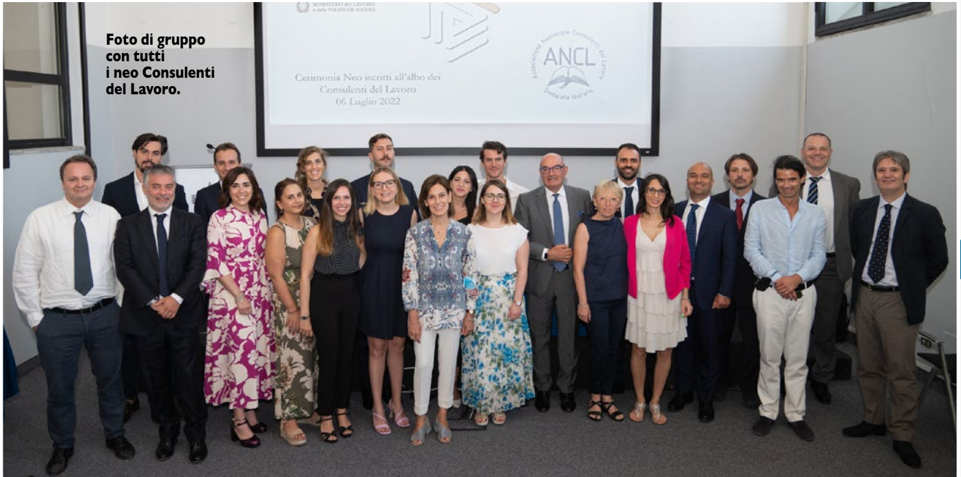
Foto di gruppo con tutti i neo Consulenti del Lavoro.