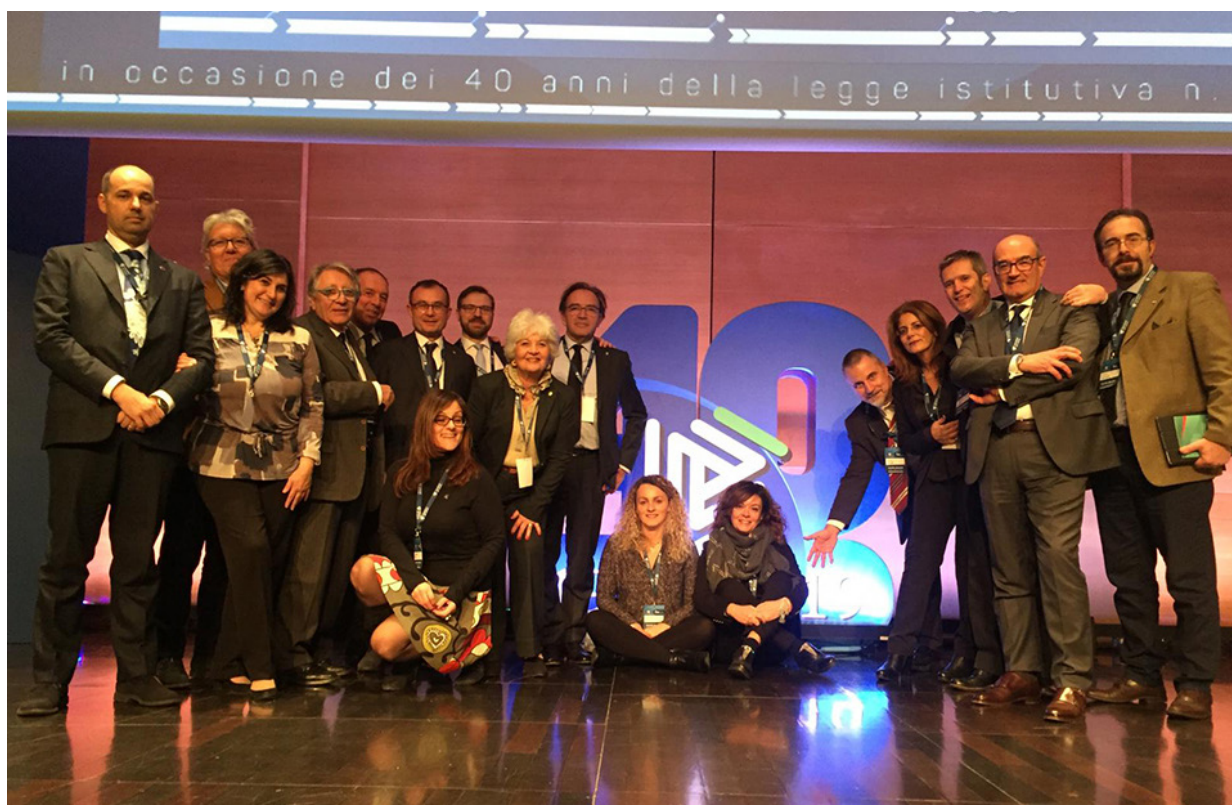
I consiglieri del CPO e dell'Ancl di Milano alla celebrazione del 40° della legge n. 12/79.

Il pensiero corre, infatti, alle ultime novità, come annunciato dal Premier, che vedono i Consulenti del lavoro protagonisti sia nel processo tributario che nei procedimenti fallimentari come curatori fallimentari.